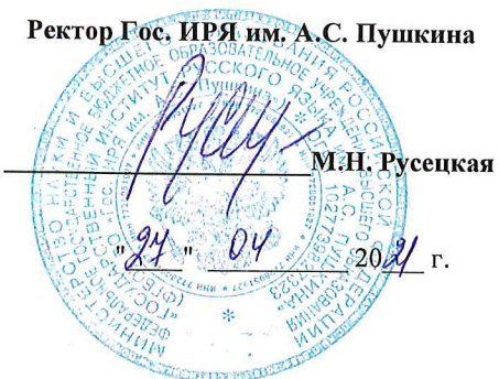
График учебного процесса