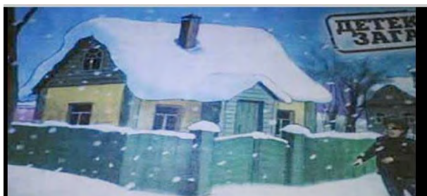
Рис. 1. Приложение «Детективные задачи»

также профессионализмы (преступник, жертва, кража). Ввиду этого, представляется потенциал адаптации данного материала для студентов-юристов.